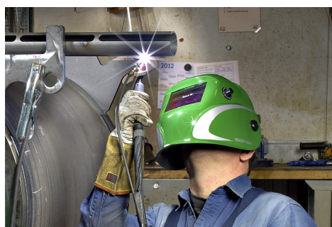
Tento svařovací stroj je ideální pro výrobu i opravy