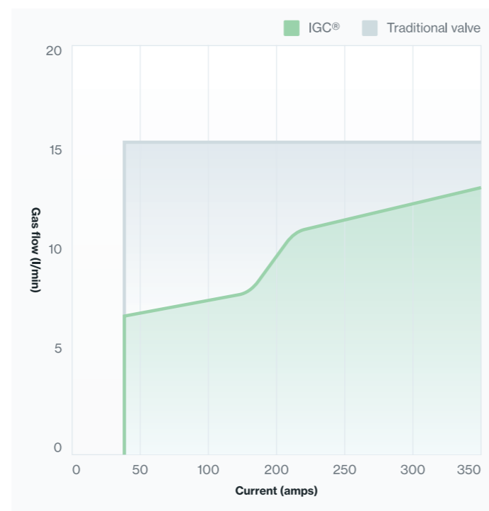
Průtok plynu při použití IGC®.

Díky tomu nedochází k narušení svaru a je také eliminována nadměrná spotřeba plynu.